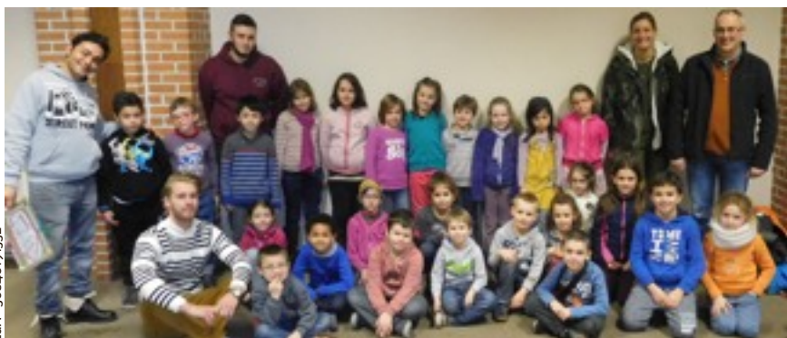
Le groupe des 7 et 8 ans était le plus nombreux.